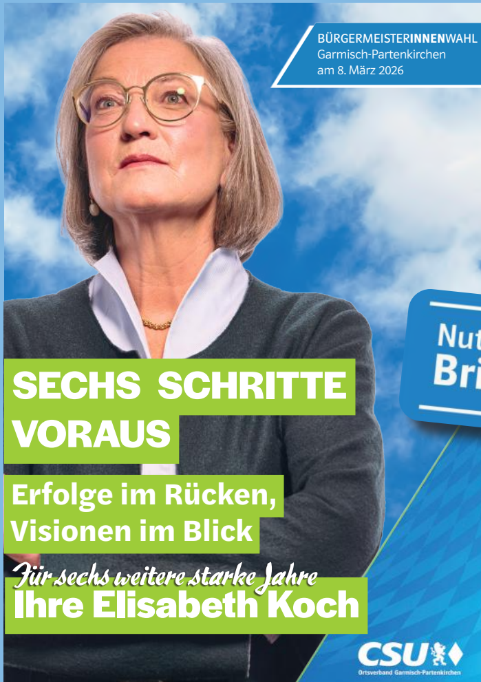
Stimmzettel zur Wahl der Bürgermeisterin