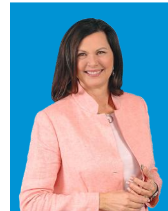
Ilse Aigner, MdL Landtagspräsidentin