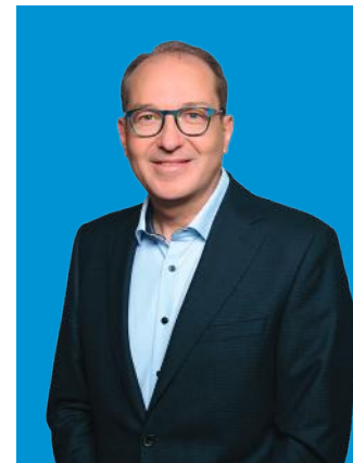
Alexander Dobrindt, MdB Bundesinnenminister